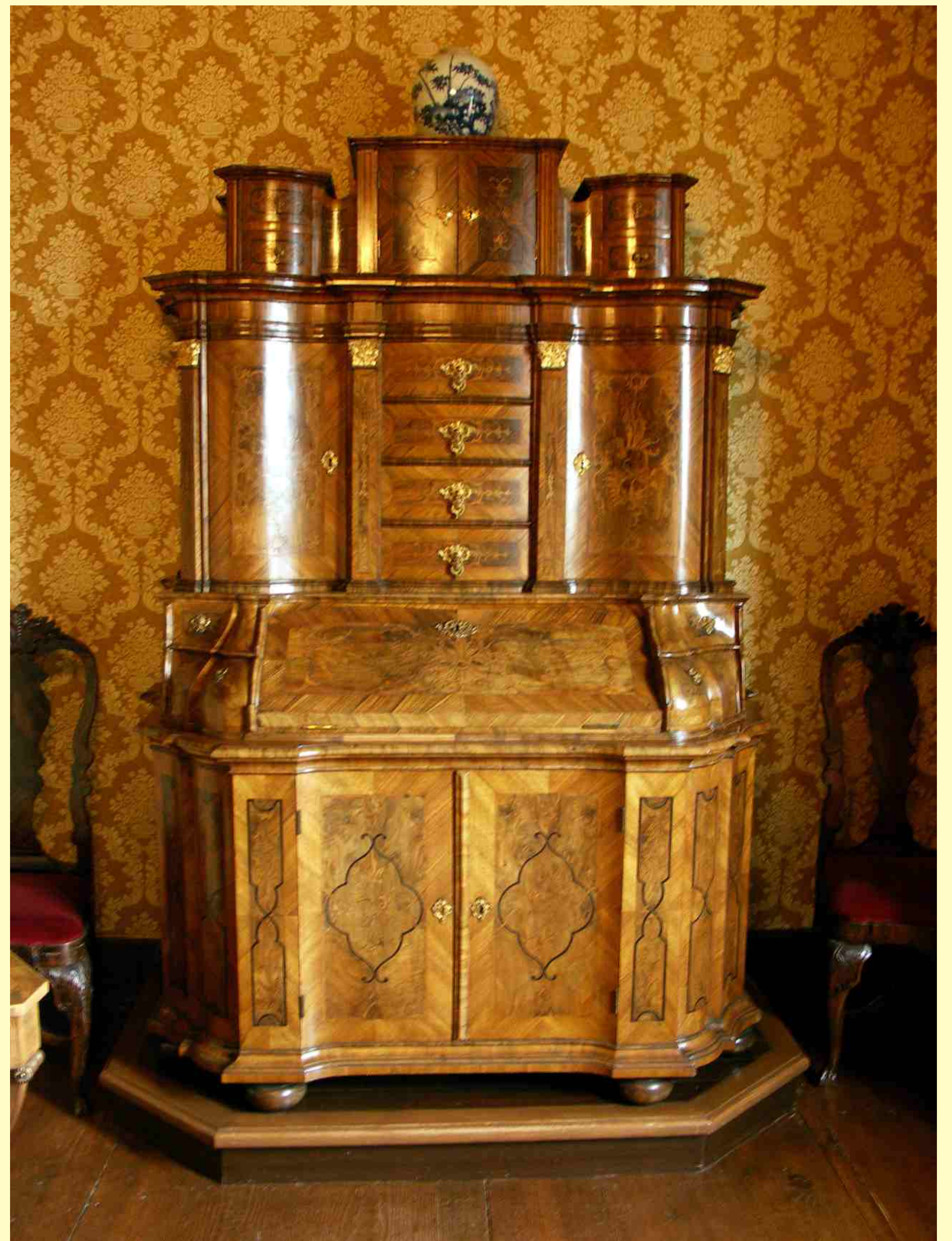
Schreibrandschrank aus Ebrach 1750