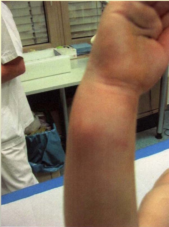
Rechter Unterarm mit Verdacht auf Unterarmfraktur