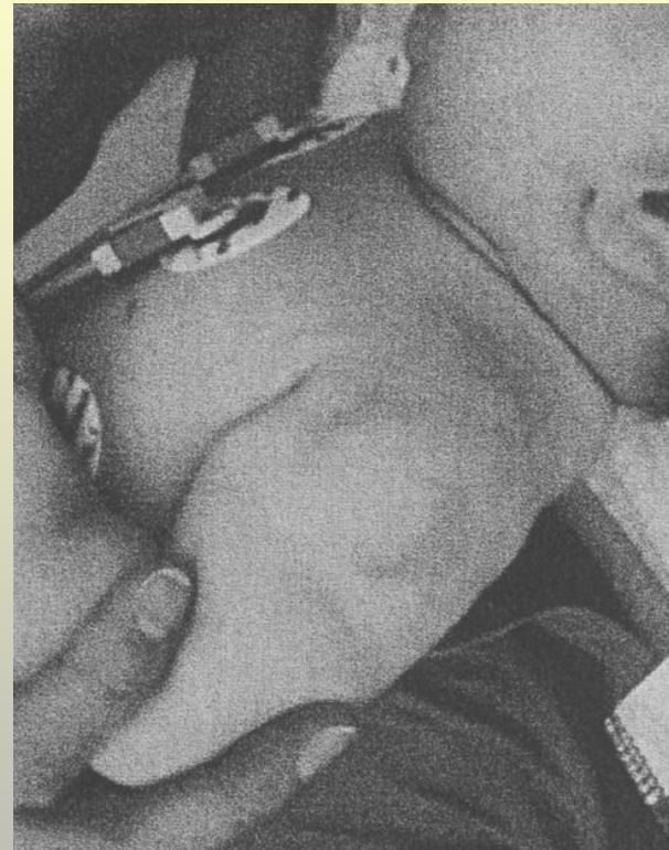
Bissverletzung am linken Oberarm