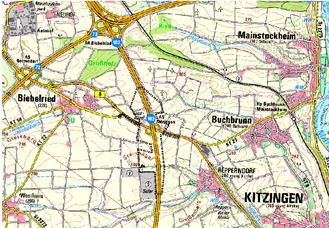
Abbildung 1: Lage des Untersuchungsgebiets

Das Untersuchungsgebiet (vgl. Abbildung 1: Lage des Untersuchungsgebiets) erstreckt sich entlang der BAB A7 von der Brücke südlich (BW 672a), über das Bauwerk Mitte (BW 671c) bis zur Brücke nördlich der AS Kitzingen (BW 671a).